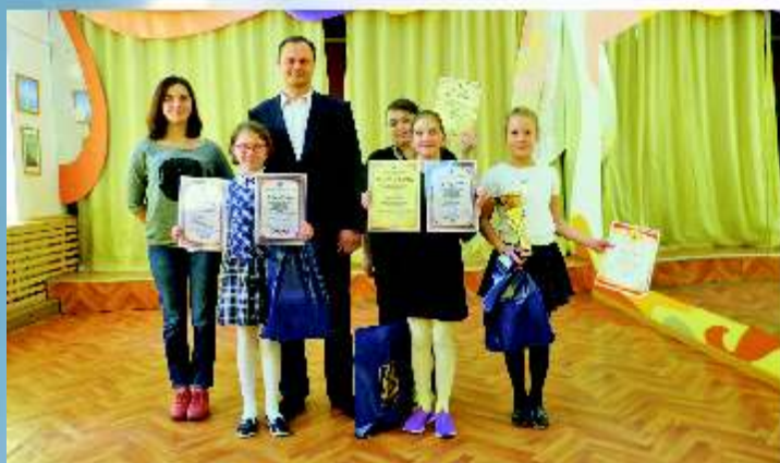
В Молодежном центре прошло награждение победителей межмуниципального конкурса Сказки экстремизму - нет!