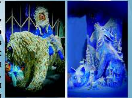
Выставка работ Новый год 2018