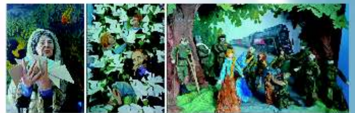
Выставка работ к Дню Победы