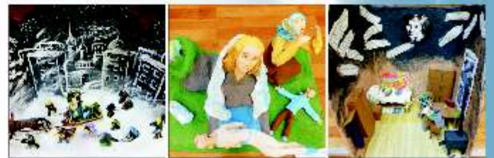
Выставка работ к Дню Снятия блокады