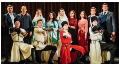
Абхазы и абазинцы в Санкт-Петербурге

Приготовление: Кукурузную муку просеять. Примерно половину муки, помещивая (чтобы не образовались комочки), всыпать в кастрюлю с толстым дном с горячей, но не кипящей, подсоленной водой и тщательно вымешать. Периодически помещивая, варить до образования кашеобразной массы. Затем, не забывая помещивать, засыпать оставшуюся муку, тщательно вымешать, накрыть крышкой и протомить в течение 15-20 мин. После еще раз размешать, загустевшая каша не должна прилипать к стенкам кастрюли. Снимите кастрюлю с огня и выложите мамалыгу на тарелку холмиком. Сверху уложите по 2-3 куска сыра сулгуни. Для приготовления каши на костре необходимо использовать чугунный котелок. Густую мамалыгу едят руками.