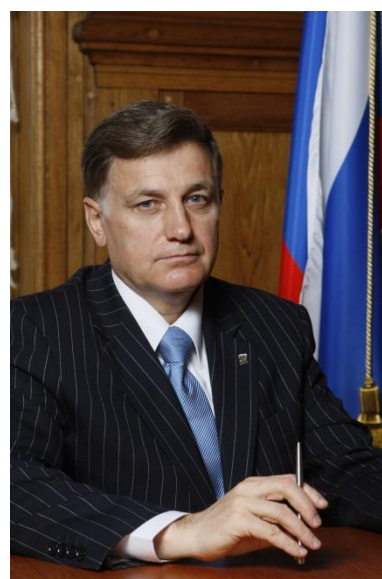
Председатель Законодательного Собрания Санкт-Петербурга, секретарь Санкт-Петербургского регионального отделения партии «Единая Россия» Вячеслав Макаров

Желаю вам крепкого здоровья, благополучия и новых свершений во имя любимого города и Отечества!