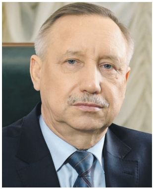
Александр БЕГЛОВ, губернатор Санкт-Петербурга