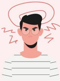
Резкая головная боль