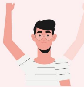
Невозможность поднять обе руки