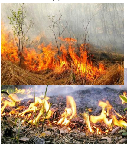
Где можно разводить костры

Итак, заметьте, в лесах разводить костры разрешается лишь в строго