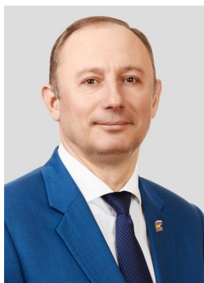
Александр Ходосок, депутат Законодательного Собрания Санкт-Петербурга, секретарь Курортного районного отделения Партии «Единая Россия»