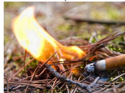
Пожарная часть (профилактическая) СПб ГКУ «ПСО Курортного района»

СПб ГКУ «ПСО Курортного района» напоминает: виновные в нарушении пожарной безопасности несут дисциплинарную, административную или уголовную ответственность. Берегите себя!!! Берегите своих близких!!! Берегите лес от пожара!!! Соблюдайте правила пожарной безопасности в лесопарковых зонах!!!