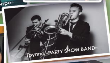
Группа «PARTY SHOW BAND»