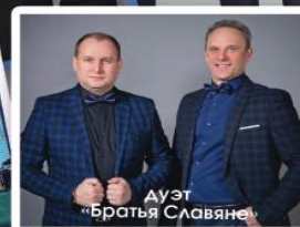
дуэт «Братья Славяне»