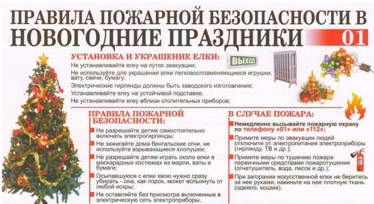
Правила пожарной безопасности в новогодние праздники