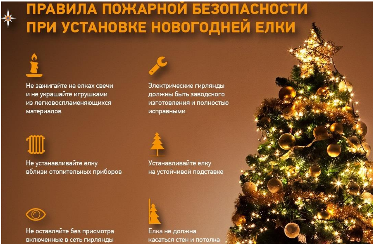
Правила пожарной безопасности при установке новогодней елки